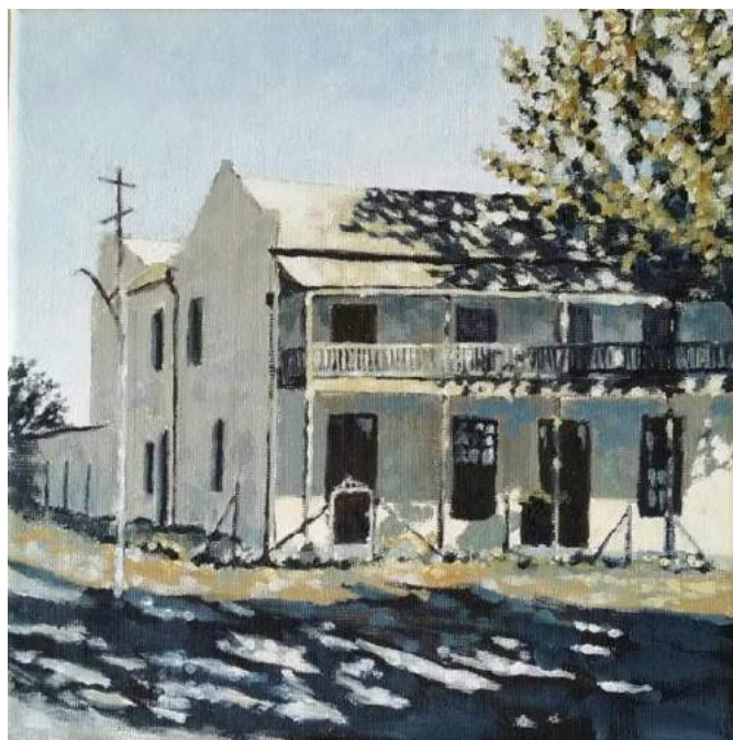
Olieverfskildery van die Breytenbach Sentrum deur Andries Bezuidenhout

Die Wasgoedlyn se digtersangers van die nag. En 'n paar verrassings!